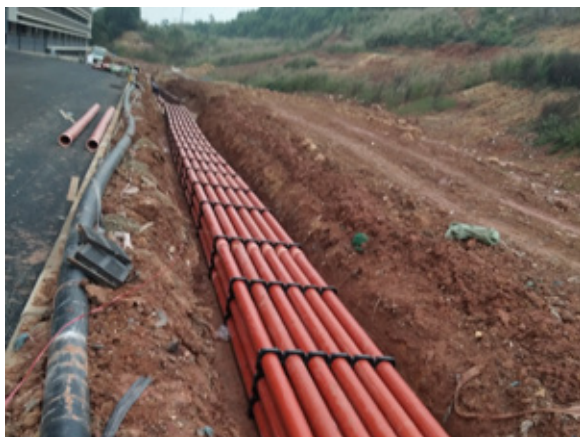
通源路配套高压电力管道新建工程 - 排管施工