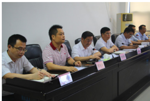
全体干部职工参加会议

于全体干部员工的辛付出，集团公司迅速发展壮大，经济实力显著增强，下阶段，绿港集团将继续大力抓好各项工作，全面提高经济效益，更好地为经开区开放开发做贡献。