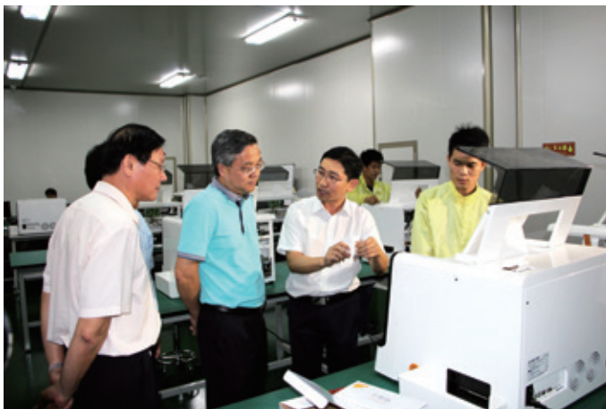
周红波市长一行参观巴迪泰公司生产车间，听取企业负责人汇报生产情况

在调研中，周红波对经开区入园企业的生产经营良好态势及前景表示看好，指出加快发展生物医药产业，是补齐南宁市工业短板、促进产业转型升级的重要举措，经开区围绕这一