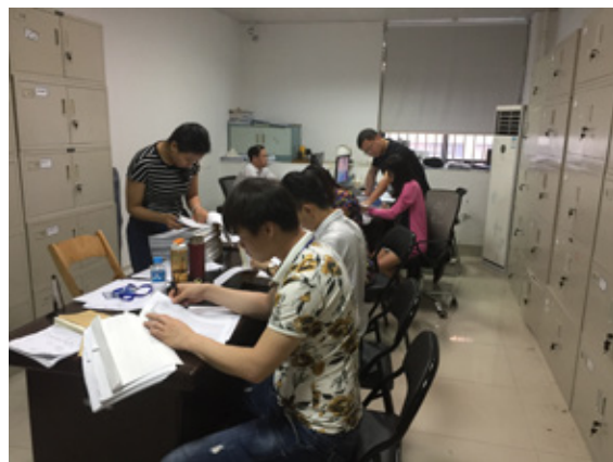
立专项检查小组正在集中精力开展八项规定“回头看”工作