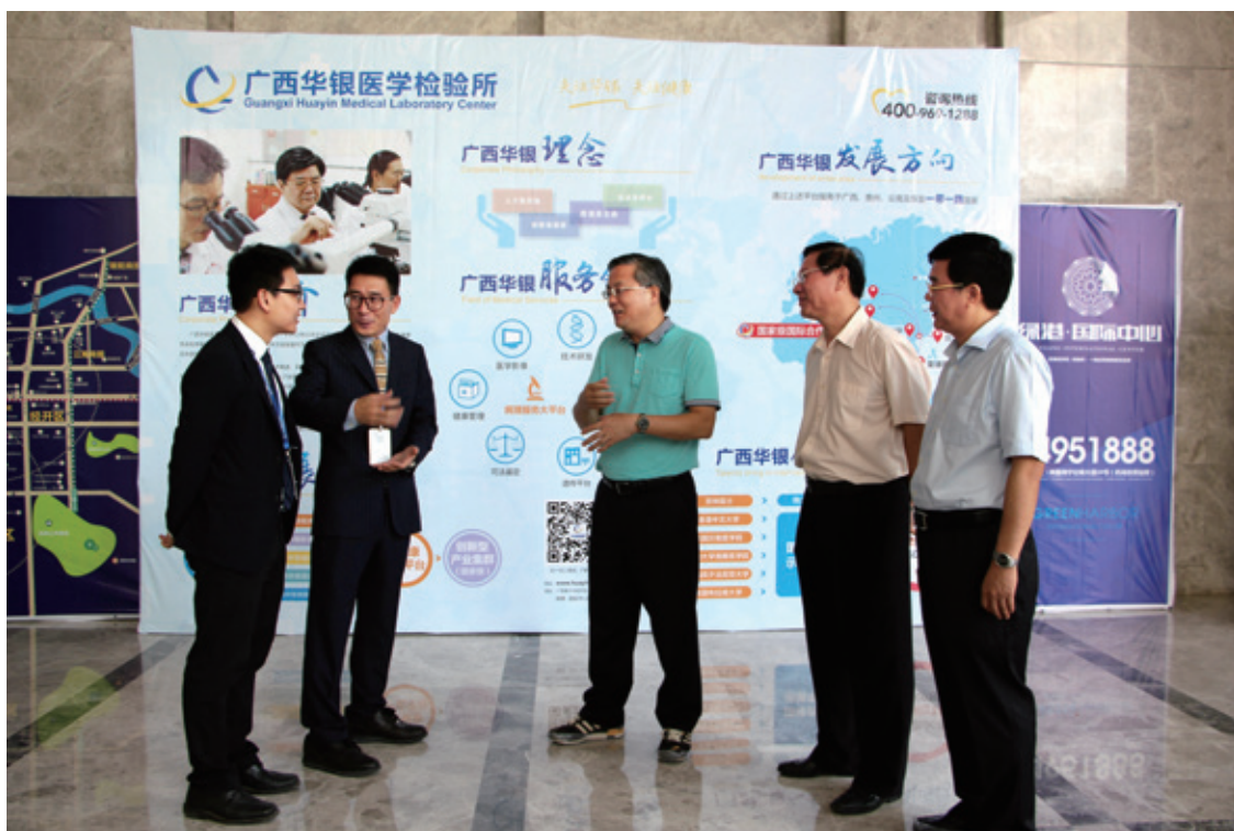
周红波市长（中）视察位于绿港国际中心 B4 栋的广西华银医学检验所，与企业负责人亲切交谈

5月25日，南宁市市长周红波率市直有关部门负责人到经开区调研生物医药产业发展情况，先后来到绿港集团建设的绿港·国际中心、金凯南工业园项目，了解入驻企业生产经营情况，协调解决项目建设和企业发展过程中遇到的困难和问题。市政协副主席陈世平，南宁经开区党工委书记、