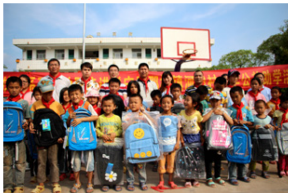
绿港集团精准扶贫工作小组与小朋友合影留念