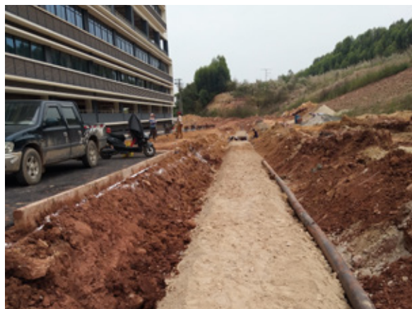
通源路配套高压电力管道新建工程 - 回填施工

5月30日，在经开区管委会和绿港集团各级领导的正确指导及大力支持下，由绿港集团下属科巨公司建设的通源路配套高压电力管道新建工程顺利完工。